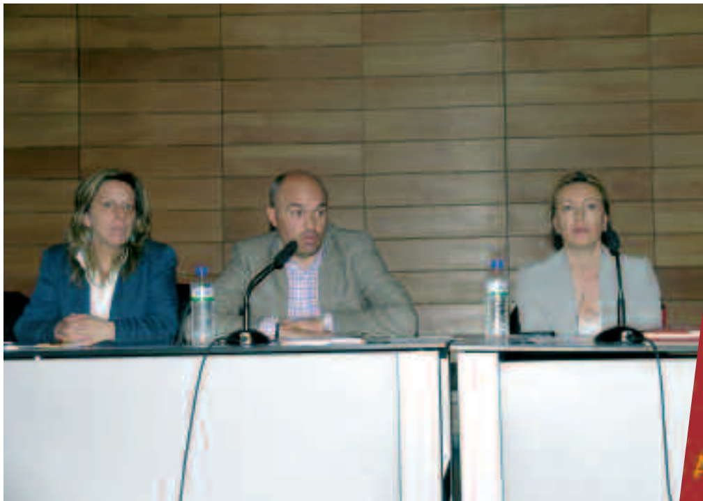
▼ ASAMBLEA INFORMATIVA DE DELEGADOS CELEBRADA EL DÍA 5 DE MAYO EN EL SALÓN DE ACTOS DE LOPE DE VEGA.

• La Federación Estatal de Sanidad de CC.OO. (FES) ha convocado a todos los técnicos superiores y auxiliares de enfermería, de toda España, a una manifestación el próximo día 27 de mayo a las 12 horas. En el caso de los técnicos superiores el sindicato reivindica que este colectivo, en base a la capacitación técnica exigida y a la complejidad de sus tareas, se encuadre en el nivel 4 de cualificación, lo que en el actual sistema educativo español significaría el acceso a una TITULACIÓN UNIVERSITARIA.