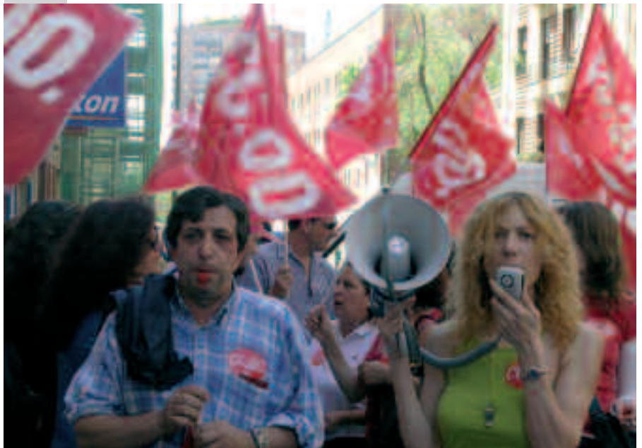
▼ CONCENTRACIÓN A LAS PUERTAS DEL CENTRO DE TRANSFUSIÓN DE CRUZ ROJA ESPAÑOLA CELEBRADA EL 27 DE ABRIL.

En la tercera concentración, al igual que las anteriores, ha tenido una participación masiva; al término de la misma, los representantes de los trabajadores se reunieron con la dirección para tratar de llegar a un acuerdo ante la inminente convocatoria de huelga. •